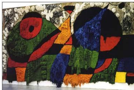
Tapis del World Trade Center de Nova York (1974). Feia 600 x 1.100 cm. Fou destruït l'11 de setembre de 2001.