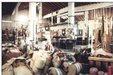
La Farinera de Tarragona . Espai en el que treballarien Miró i Royo del 1973 al 1980. El galerista Aimé Maeght va demanar a Royo que trobés un molt ampli espai a Tarragona per poder fer l'encàrrec d'un gran tapís per al World Trade Center de Nova York.

En endavant, Miró i Royo treballarien a La Farinera de Tarragona. Dels seus murs sortirien d'altres 6 tapissos també monumentals (fins al 1980) i 32 "sobreteixims" (1972-1973).