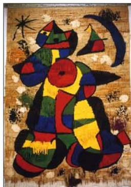
Tapís de la Fundació Miró de Barcelona (1979). Mides: 750 x 500 cm.