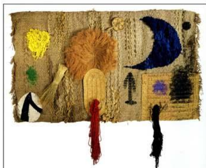
Sobreteixim 3 (1972). Mides: 165 x 288 cm.