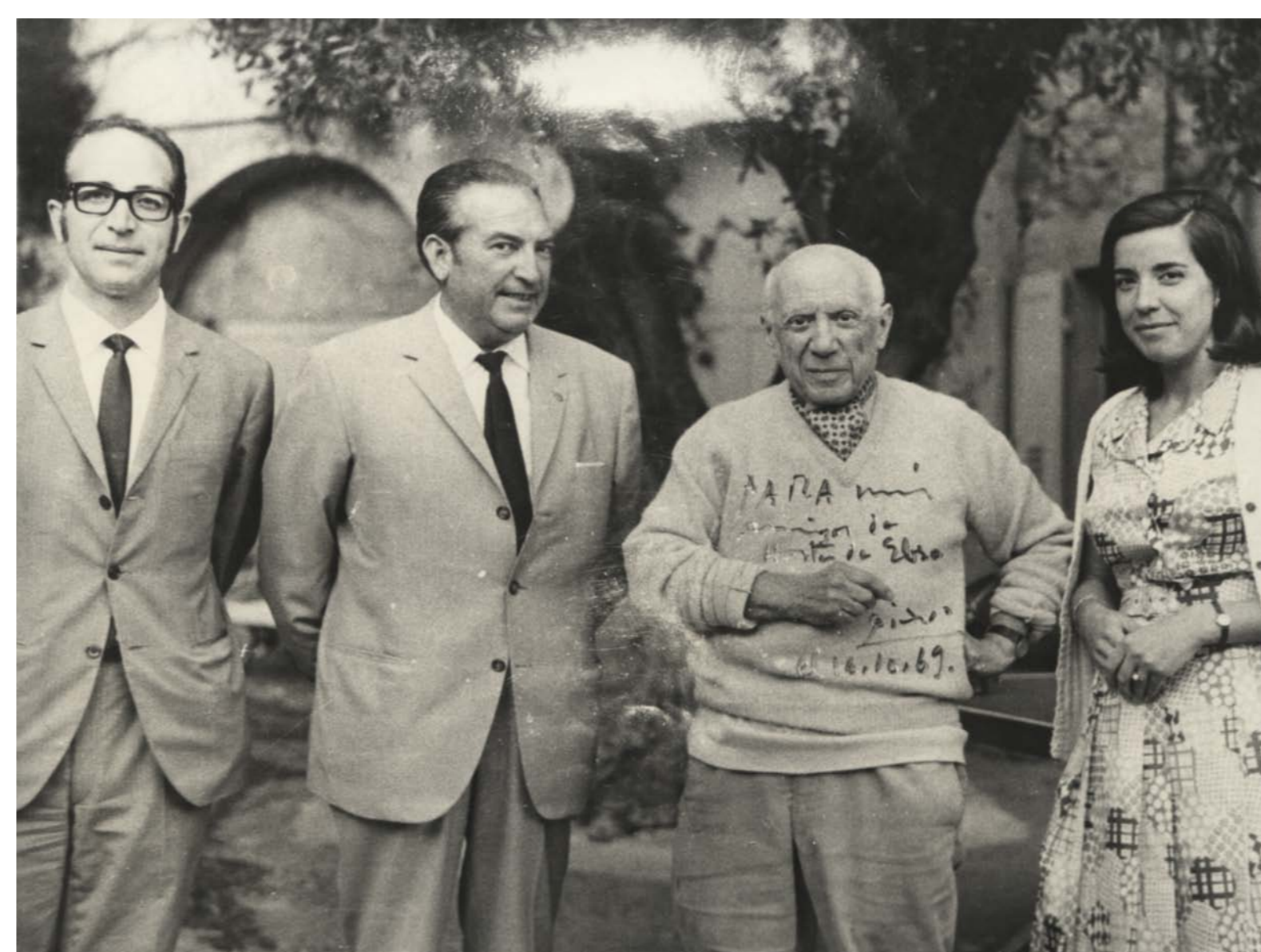
Picasso amb la gent d’Horta que el va visitar l’any 1969.