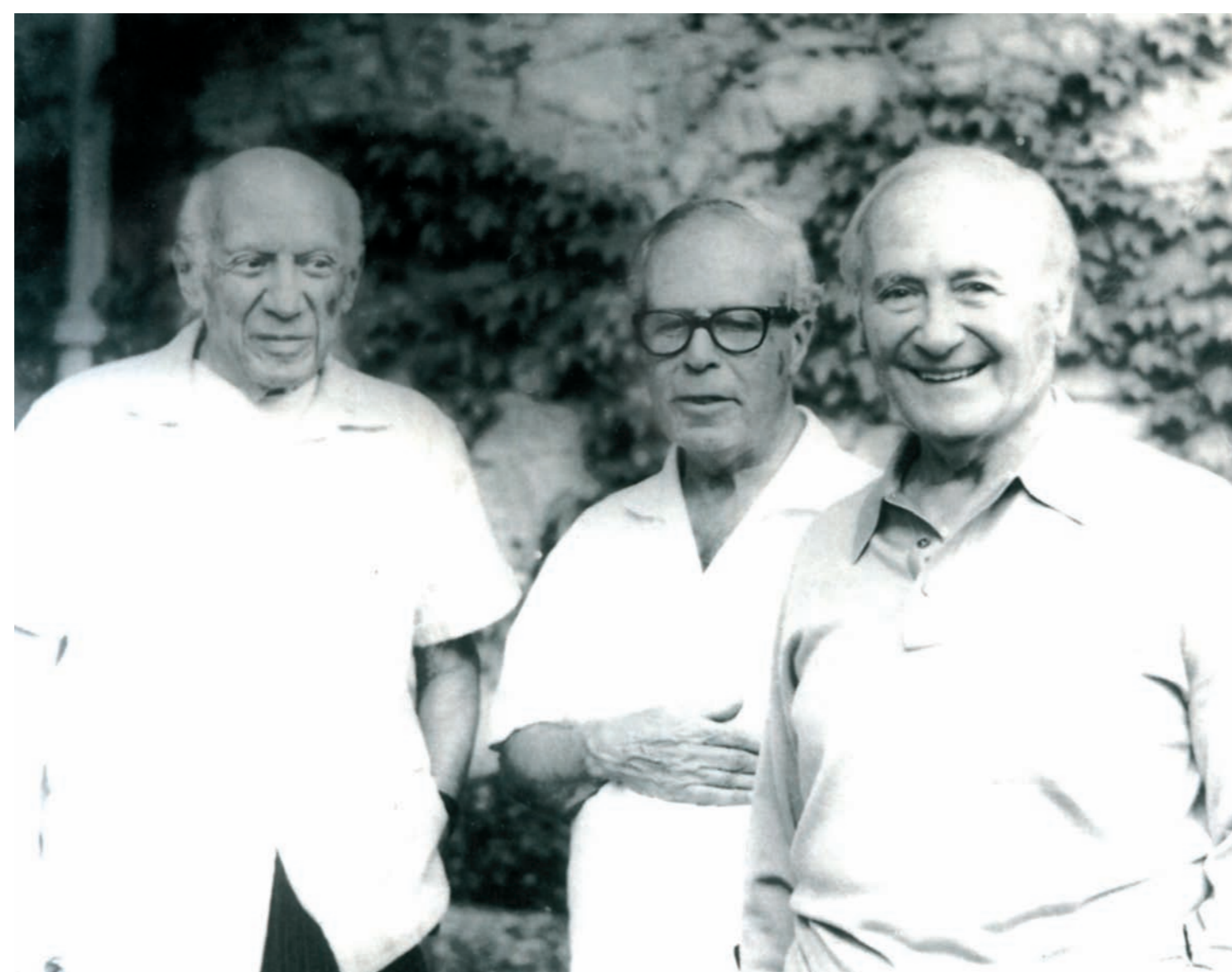
Picasso, Sert i Miró