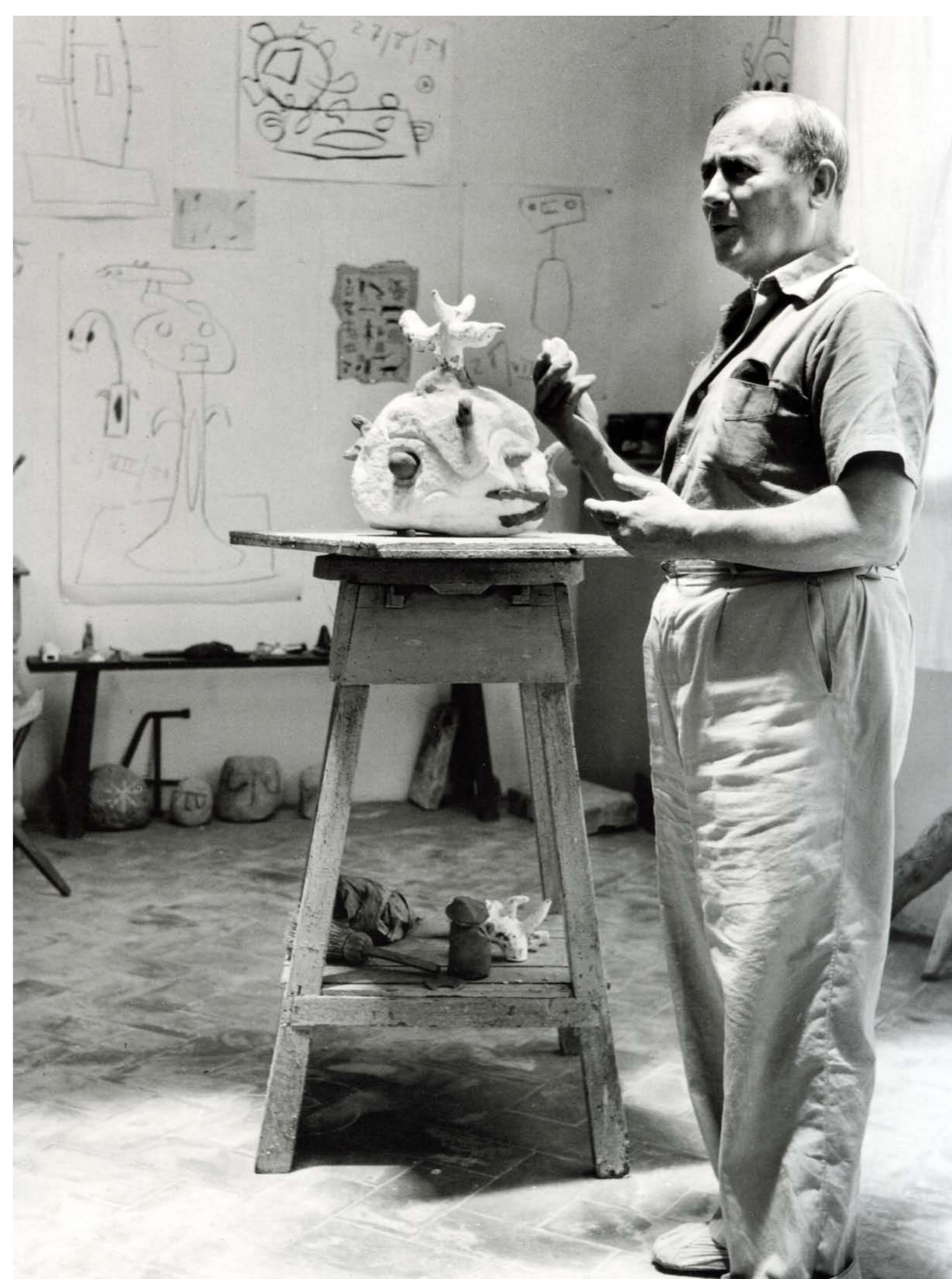
Miró amb escultura