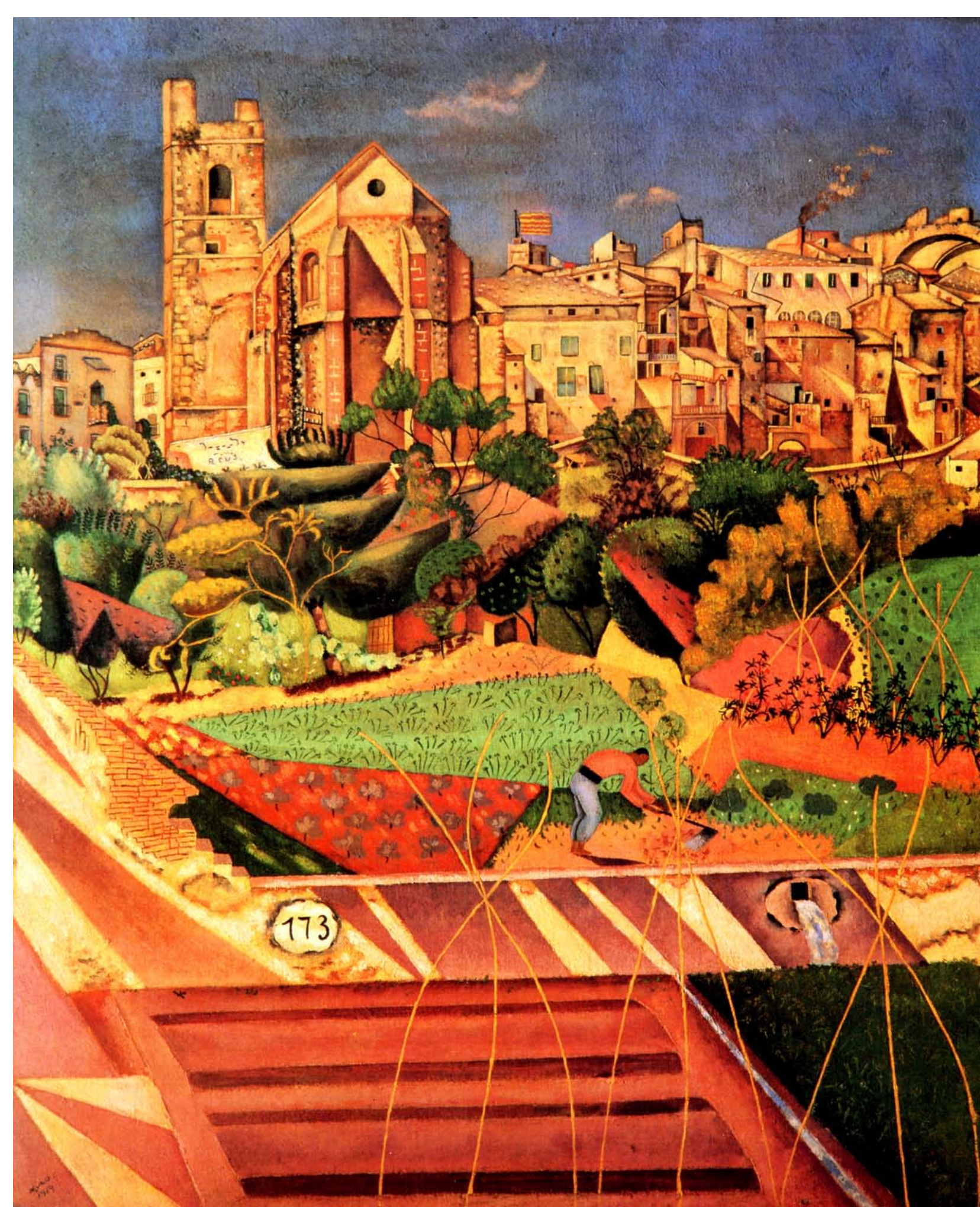
Poble i església de Mont-roig (1919). La bandera catalana és un afegit del pintor.