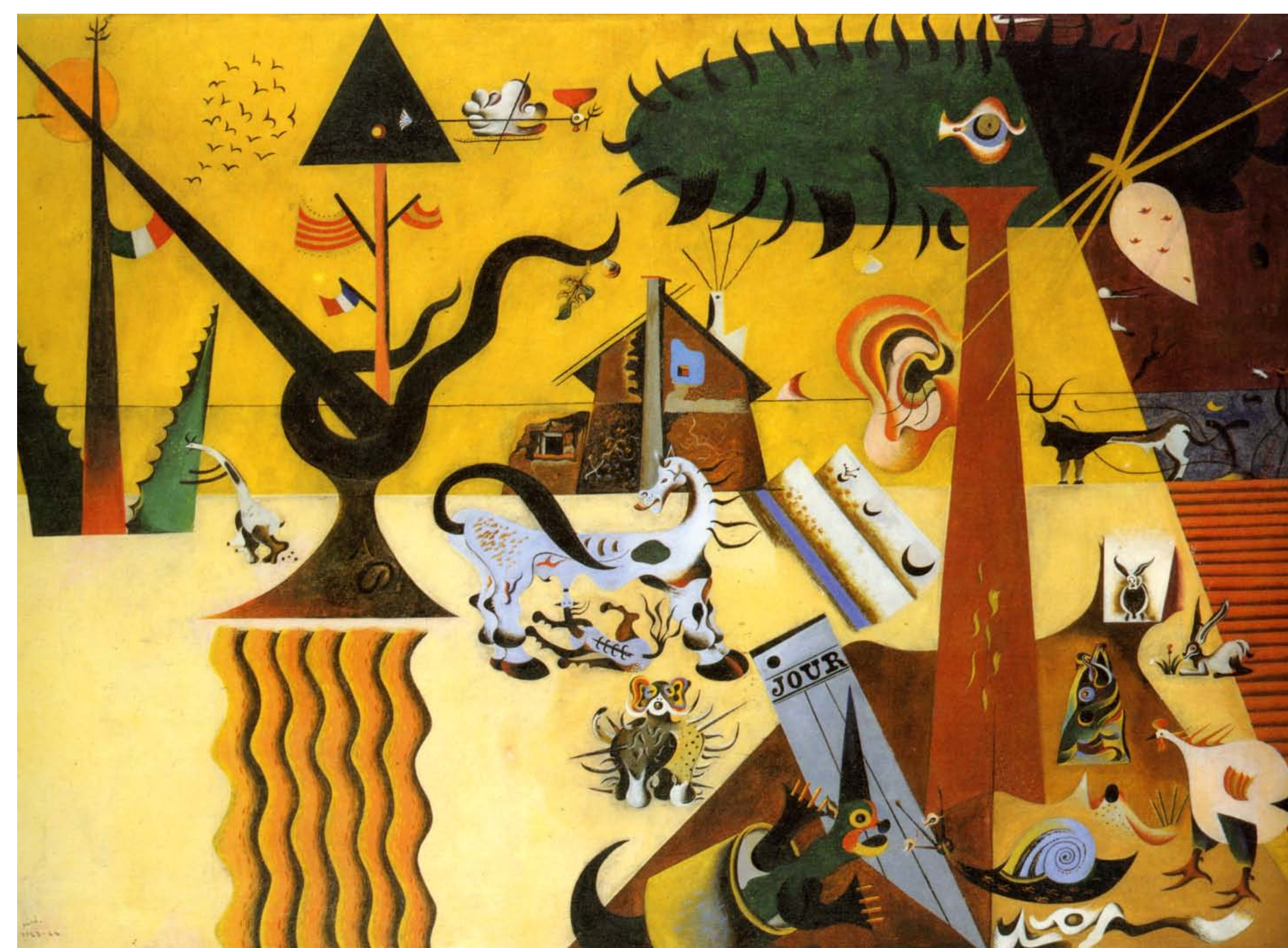
Terra llaurada (1923/1924). És, alhora, un resum de la seva etapa anterior i un pas endavant vers el que serà l’imaginari mironià.