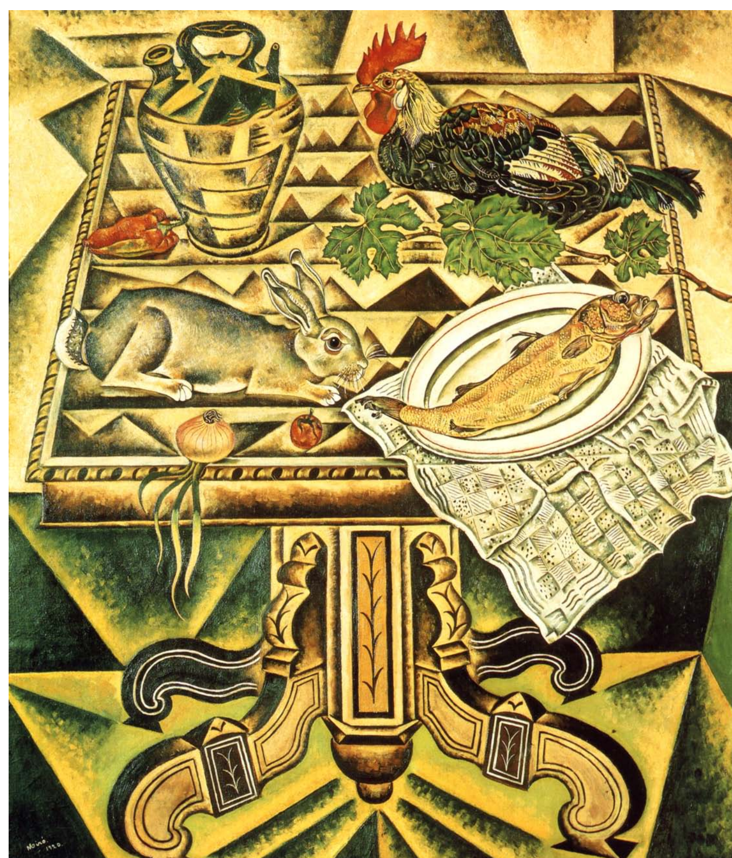
La taula (1920). Encara està al seu mas.