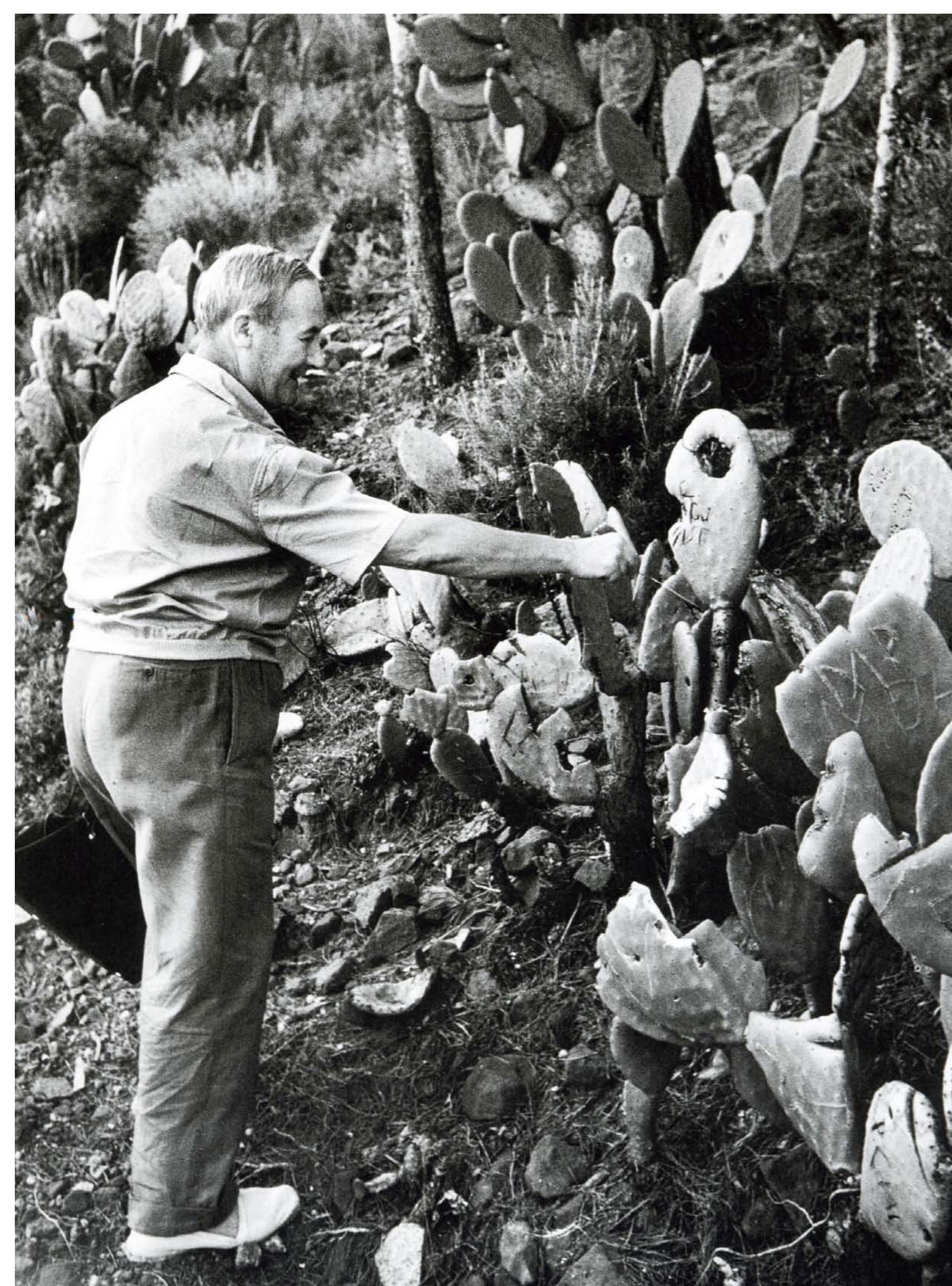
Al peu de la muntanya de l’ermita, pujant pel camí vell, encara ara està ple de figues de moro.