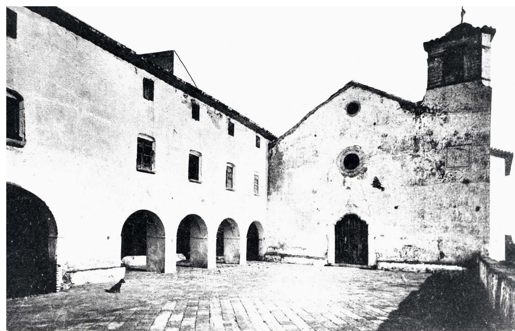
Ermita de la Mare de Déu de la Roca (cap al 1910).