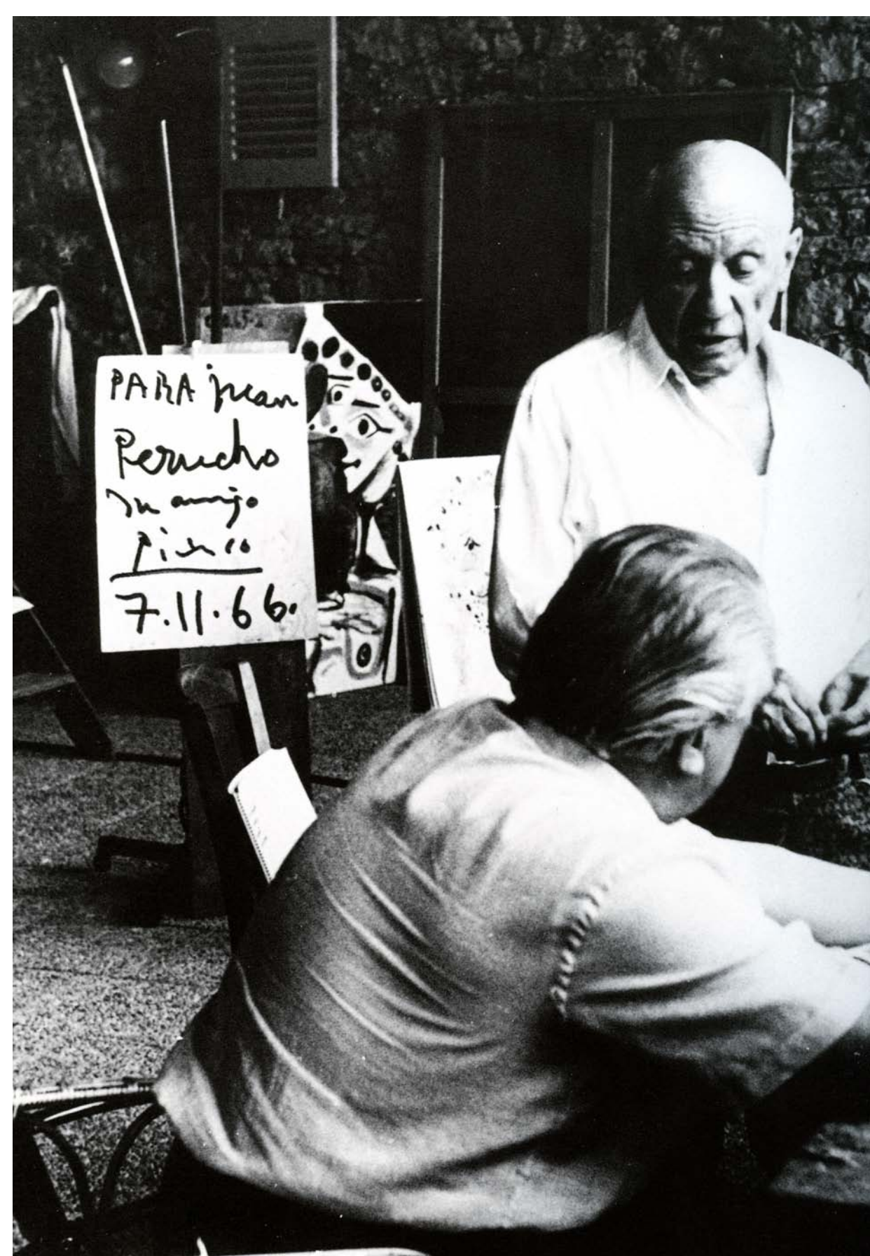
Picasso i Perucho

“Picasso va ser molt popular al poble. Queden, tanmateix, poques persones que el recordin, després de tants anys... A les nits anaven al cafè. Picasso tenia una mirada inquietant, devoradora...” (“Ramonet, la nena de les trenes i la rosa petrificada”, a Històries apòcrifes, 1974 ).