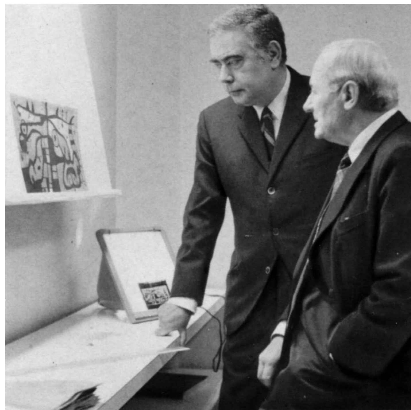
Miró i Perucho

“Hom a dit moltes vegades que en les seves pintures hi ha la llum de Mont-roig... Hi ha, però, una altra cosa: hi ha la vida que li ha ensenyat Mont-roig... Sense aquest camp de Mont-roig al qual Miró retorna una i altra vegada, no existirien aquests quadres fabulosament vius i desconcertants... Les coses anaven adquirint la seva real significació davant els ulls atònits de Miró...” (“El cavaller, les papallones i Joan Miró”, a Incredulitats i devocions , 1982).