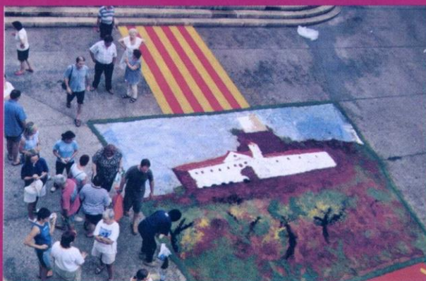
Plaça Mossèn Gaietà Ivern.