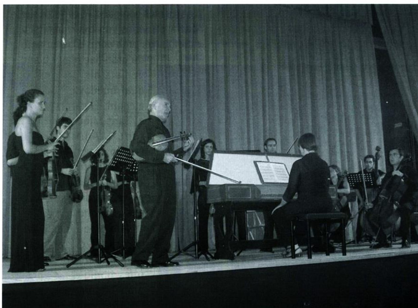
Moment de l'actuació de l'Orquestra de Cambra del Conservatori de Vila-seca.