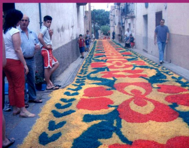
Carrer Sant Miquel