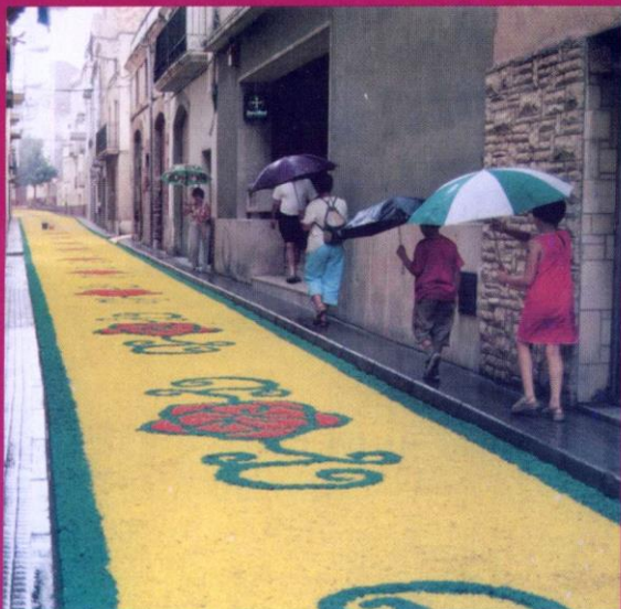
Carrer Agustí Sardà.