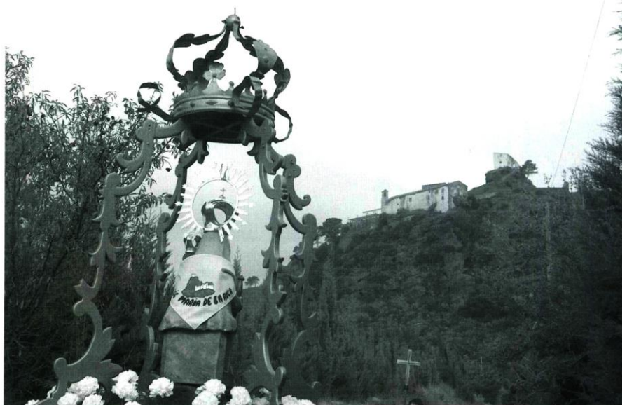
Processó de retorn de la Mare de Déu al santuari.

El diumenge 29 d'agost, de bon matí els carrers per on havia de passar la Mare de Déu de la Roca es van guarnir per a l'ocasió. Els veïns dels carrers per on havia de passar la imatge de la Verge van quedar d'acord per guarnir els carrers, i es van posar a treballar molt de matí per a l'esdeveniment. En el carrer Verge de la Roca, plaça Joan Miró, carrer del Calvari i Francesc Riba i Mestre els veïns van treure al carrer les seves