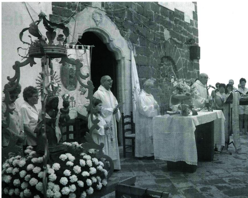
Missa concelebrada a la Plaça de l'Ermita.

van quedar penjant sobre la paret. De fet, després de dinar molts veïns van sortir al carrer a retocar les catifes i semblava que no hagués ni plogut.