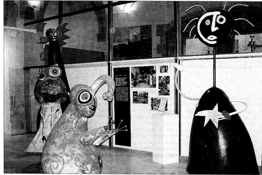
El Centre Miró de Mont-roig celebrará su primer aniversario el próximo 23 de abril.

Aprovechando la ampliación del Centre Miró, también se ha crea-