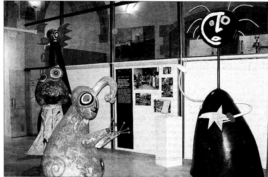
El Centre Miró de Mont-roig celebrará su primer aniversario el próximo 23 de abril.

Aprovechando la ampliación del Centre Miró, también se ha crea-