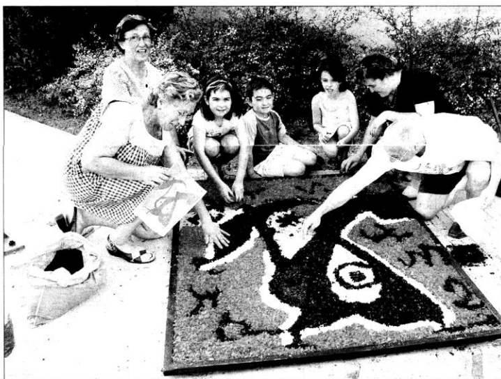
Vecinos de la calle Vilanova d'Escornalbou con el cuadro «Dona, ocells».