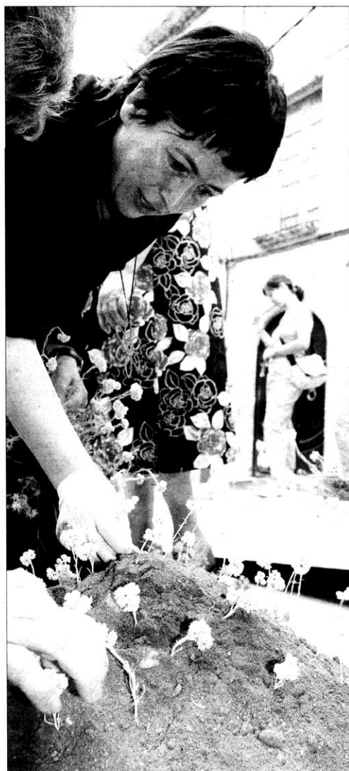
Los vecinos no sólo reproducen los cuadros. También decoran el pueblo.