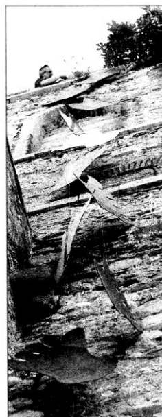
Cartones que cuelgan del Centre Miró.