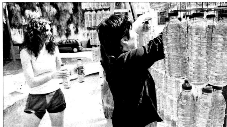
Detalle de uno de los montajes más espectaculares: 2.000 botellas que reflejan los colores de Miró.

Hoy, ‘cercavila’ (12 h.) con los Ninots mironians, grallers de Mont-roig y la Cobla d’en Taudell