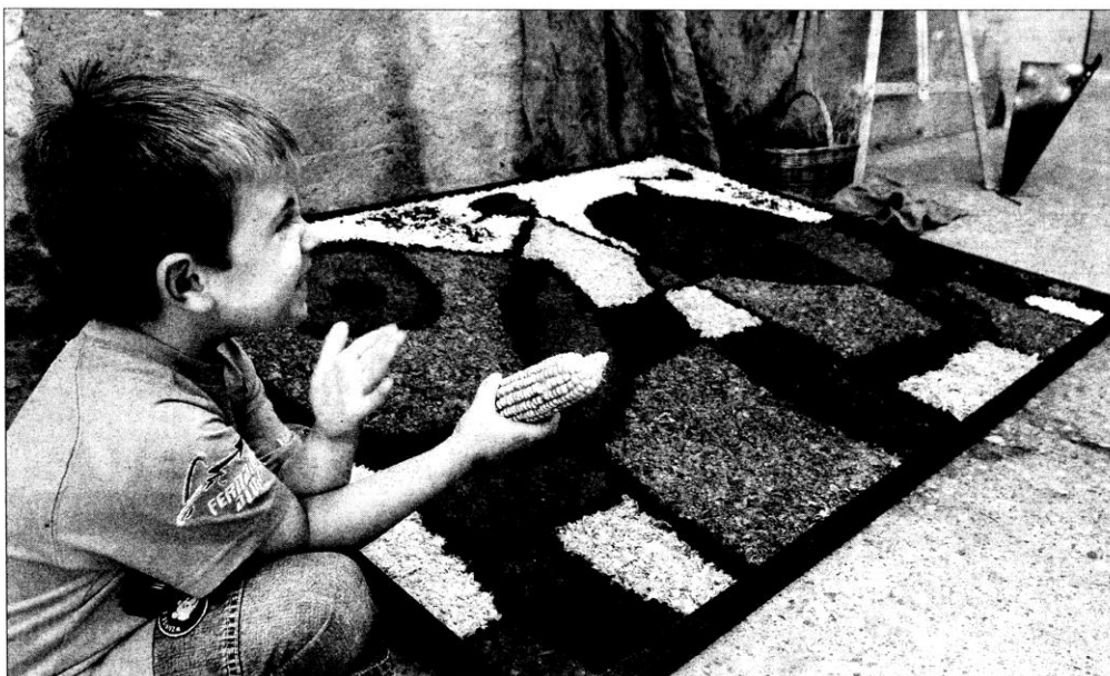
Un pequeño vecino de la calle Josep M. Gran i Cirera con «Pintura, dibuix per una catifa».