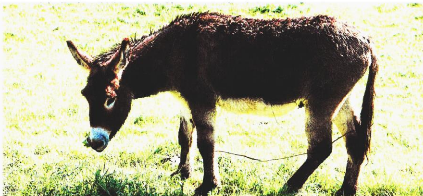
Un ase actual com el que va pintar Miró a Hort amb ase (1918)

que semblin terra llaurada com els que ell pintava, buscant cargols i gallines per retratar-los", diu. I és que el cel i la terra són dos elements característics del paisatge mironià. L'esforç d'aquest temps ha donat com a resultat una seixantena d'imatges amb la seva corresponent explicació sobre el quadre en què estan inspirades. "Hem volgut mostrar que Miró pintava tot allò que veia i ensenyar-ho".