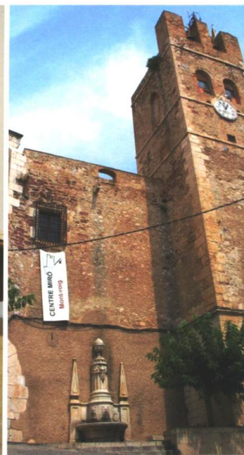
Tapis original i puzzle i façana del Centre Miró