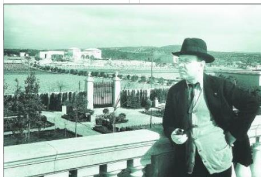
Pau Casals en la actual Vila Museu Pau Casals, en El Vendrell.

La ruta del Paisatge dels Genis se puso en marcha en 2012 como