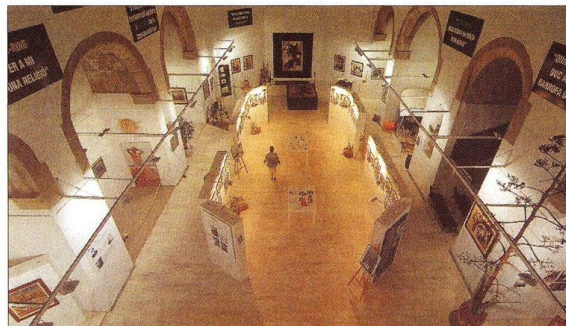
El Centre Miró proyecta documentales sobre Joan Miró y Mont-roig.

mar. Además de disfrutar de la tranquilidad y el agua cristalina todos los amantes de la náutica podrán practicar alguno de sus deportes favoritos. Miami Platja cuenta con quince deportes náuticos diferentes a lo largo de sus doce kilómetros de playa. Entre ellos destacan las excursiones en kayak, las rutas en optimist, el submarinismo y la banana board. Además también se puede practicar golf en Bonmont golf: http://www.bonmont.es/