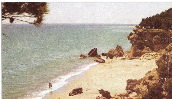
Cala Bot, una playa que combina arena y piedra.