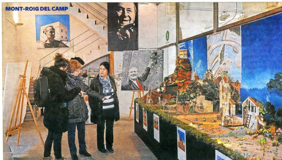
Es el cuarto año que el pesebre homenajea al gran artista vinculado a Mont-roig.

La plantilla inicia un paro parcial. Protestan por el expediente de regulación de empleo que empezará a aplicarse el próximo 29 de diciembre. La multinacional francesa argumenta una importante bajada de producción. P 41