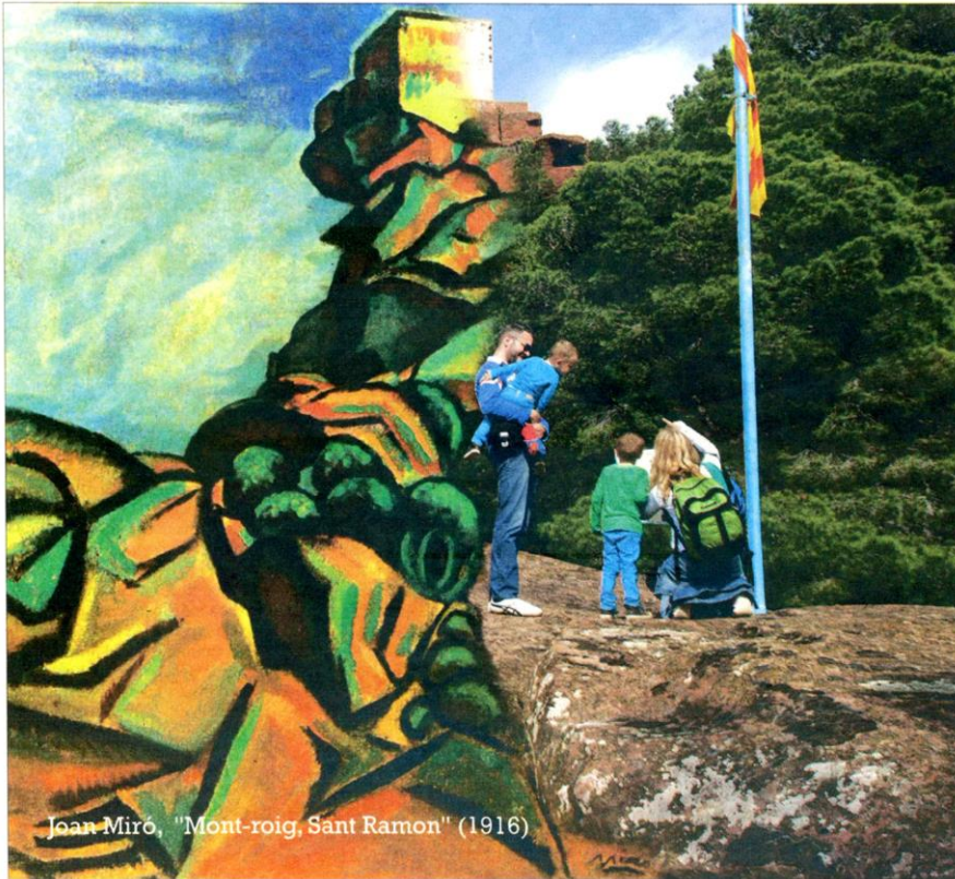
Joan Miró, "Mont-roig, Sant Ramon" (1916)