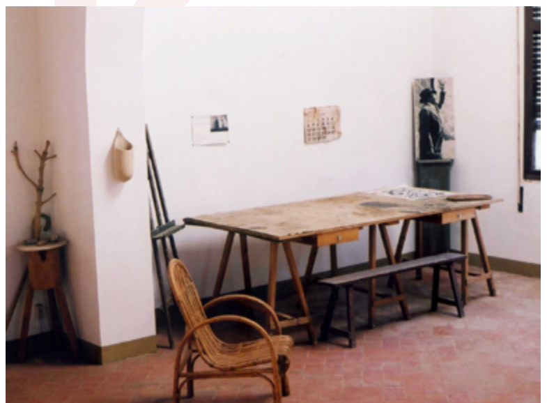
"Taller de Mont-roig. A la dreta, fotografia de Joan Prats"

El dimarts 26 de juny de 1979 vam anar a Palma de Mallorca, al taller de Son Abrines, a enregistrar per al meu documental "D'un roig encès: Miró i Mont-roig". Fou emotiu el llarg pla on Miró recorre, poc a poc, el seu taller, mirant amb detall i tendresa els quadres que hi havia escampats per tot arreu; allargava la mà com si s'acomia. Després, arriba a la rampant escala de fusta que el portarà a l'entresolat; allí, passant amb cura entre les taules plenes de dibuixos, s'apropa fins la barana i s'atura a contemplar, amb delectació, el conjunt del taller. Aquest pla s'ha reproduït a molts altres documentals.