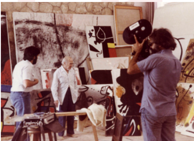
"Taller de Palma. Rodatge de "D'un roig encès..."