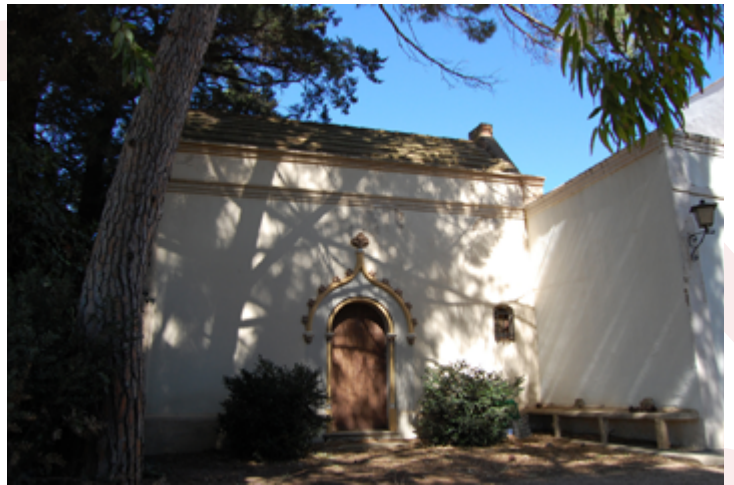
"Mas Miró. Capella"