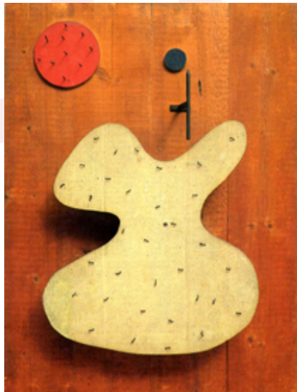
"Relief construction" (1930)