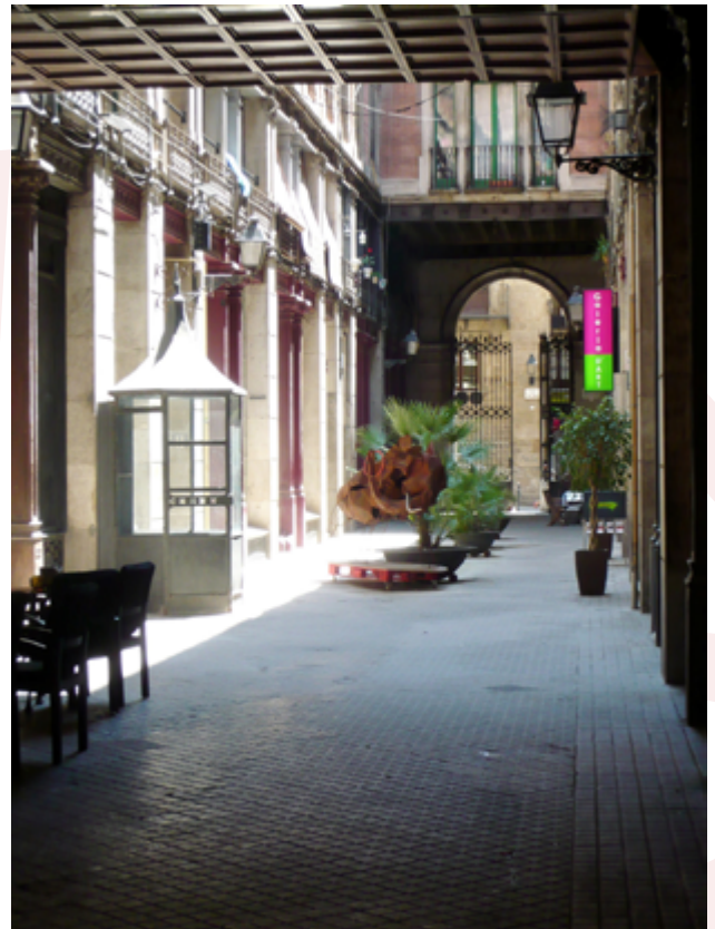
"Passatge del Crèdit"