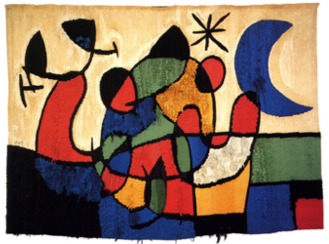
"Tapís de Tarragona" (1970)