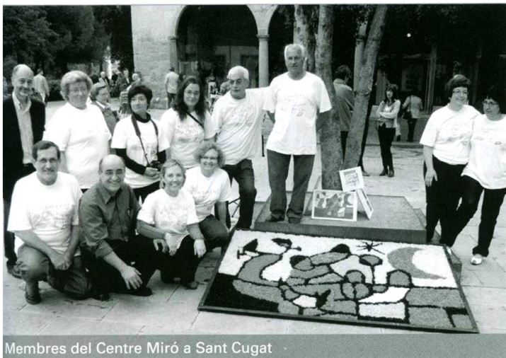
Membres del Centre Miró a Sant Cugat

Tot es va acabar amb un sopar de germanor cultural entre els tres pobles: Horta de Sant Joan, Sant Cugat del Vallès i Mont-roig del Camp.