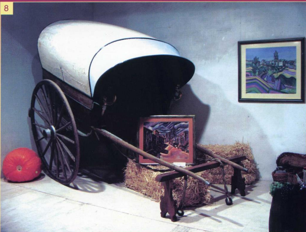
8- La Tartana i dos quadres de Prades.