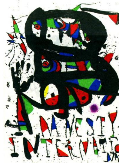
CARTELL PER A AMNISTIA INTERNACIONAL' (1976). SUCCESIÓ MIRÓ