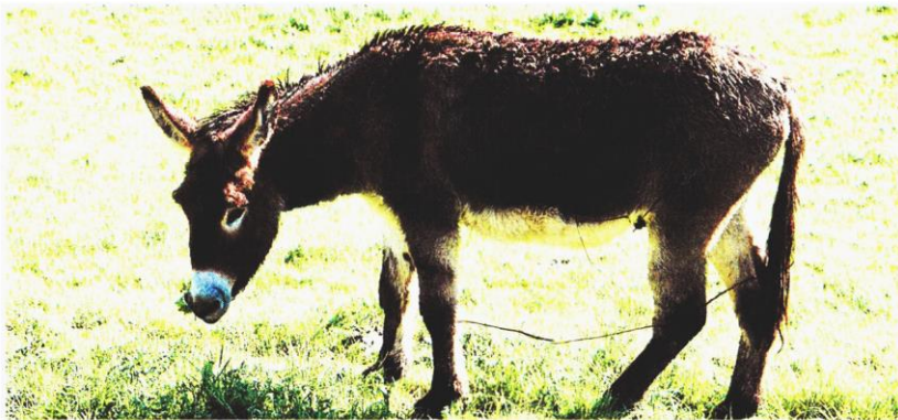
Un ase actual com el que va pintar Miró a Hort amb ase (1918)